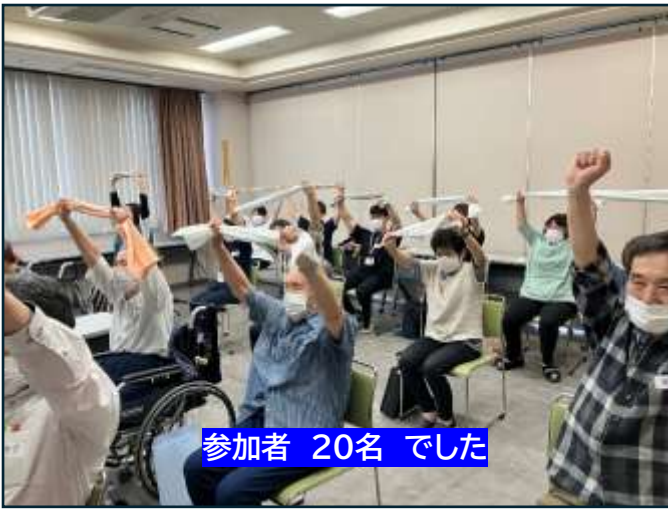
参加者 20名 でした