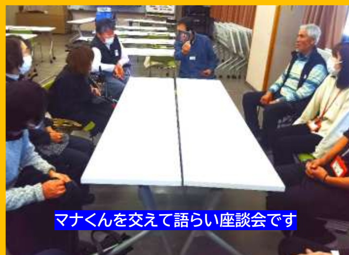
マナくんを交えて語り座談会です